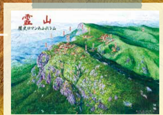
霊山寺(霊山城)復元イメージ