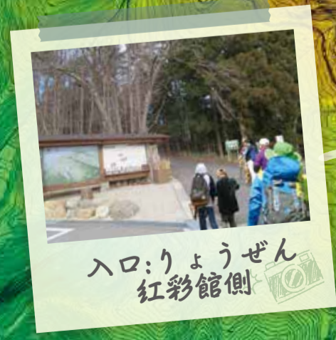
入口:りょうぜん 紅彩館側