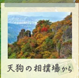
天狗の相撲場から